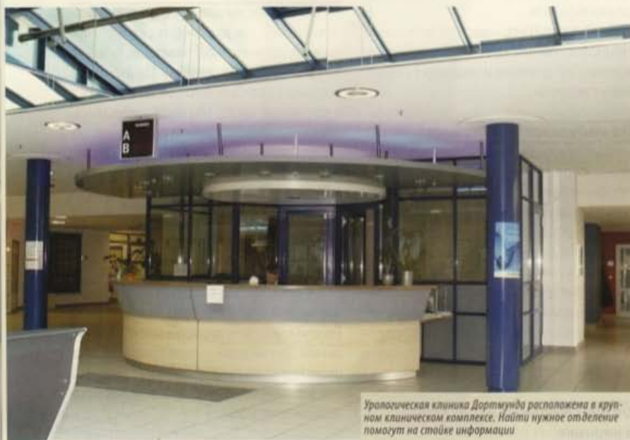
Урологическая клиника Дортмунда расположена в крупном клиническом комплексе. Найти нужное отделение помогут на стойке информации