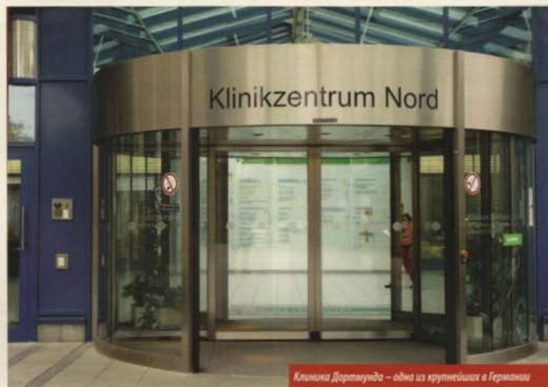
Клиника Дортмунда – одна из крупнейших в Германии

ЦЕНТР КАРЦИНОМЫ ПРОСТАТЫ аккредитируется согласно строгим критериям СЕРТИФИЦИРУЮЩЕЙ ОРГАНИЗАЦИИ.