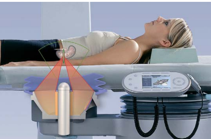
Positionierung des ESWL-Schallkopfes an die Flanke des Patienten und Fokussierung auf einen Nierenstein

siert werden. Ferner können Steinfragmente im Harnleiter stecken bleiben und dort eine Kolik auslösen. Aus diesem Grund kann es bei größeren Steinen notwendig sein, eine sogenannte Harnleiterschleife einzulegen, um den Urinabfluss von der Niere in die Blase sicherzustellen. Bei großer Steinmasse werden mehrere ESWL-Behandlungen benötigt, um eine komplette Steinfreiheit zu erzielen.