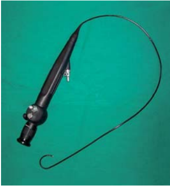
Flexibles Endoskop zur minimal-invasiven Entfernung von Steinen aus der Niere