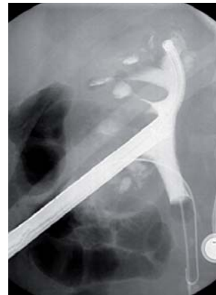
Röntgenbild mit dem in die Niere eingebrachten Endoskop

Die Risiken des Verfahrens sind gering. Eine durch die Punktion der Niere ausgelöste Blutung stoppt fast immer von selbst. In den seltenen Fällen einer verstärkten Blutung kann diese fast immer durch selektiven Verschluss des blutenden Gefäßes gestillt werden. Daneben kann es zum Auftreten von Fieber kommen, was eine kurzfristige Antibiotikatherapie notwendig macht. Ernste Verletzungen der Niere sind mit den dünnen Instrumenten extrem selten.