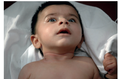
Beachten Sie den erschrockenen Blick, vor allem aber die Einziehungen im Halsbereich, diese sind Ausdruck der Atemnot!

Wichtig ist die Unterscheidung zur lebensgefährlichen Kehlkopfdeckelentzündung (Epiglottitis), die dank der Routineimpfung gegen die Hirnhautentzündung (Hämophilus influenzae B) quasi verschwunden ist. Die Kehlkopfdeckelentzündung kommt ebenfalls im Kleinkindalter vor. Das Kind hat hohes Fieber, eine kloßige Sprache (tönt wie mit einer heißen Kartoffel im Mund), es will nicht mehr trinken, der Speichel läuft aus dem Mund, und es hustet nicht. Es kann zum völligen Verschluss der Atemwege kommen. Bei solchen Symptomen oder schwerer Atemnot müssen Sie Ihren Arzt oder den Notfallarzt kontaktieren.